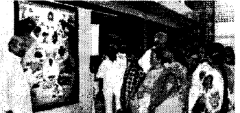
புகையிலை எதிர்ப்பு தின விழிப்புணர்வு கண்காட்சி. புகையிலை எதிர்ப்பு தின விழிப்புணர்வு கண்காட்சி.

சென்னை: செ. 31: சென்னை நகரில் நடைபெறும் புகையிலை எதிர்ப்பு தின விழிப்புணர்வு கண்காட்சி. சென்னை நகரில் நடைபெறும் புகையிலை எதிர்ப்பு தின விழிப்புணர்வு கண்காட்சி. சென்னை நகரில் நடைபெறும் புகையிலை எதிர்ப்பு தின விழிப்புணர்வு கண்காட்சி.